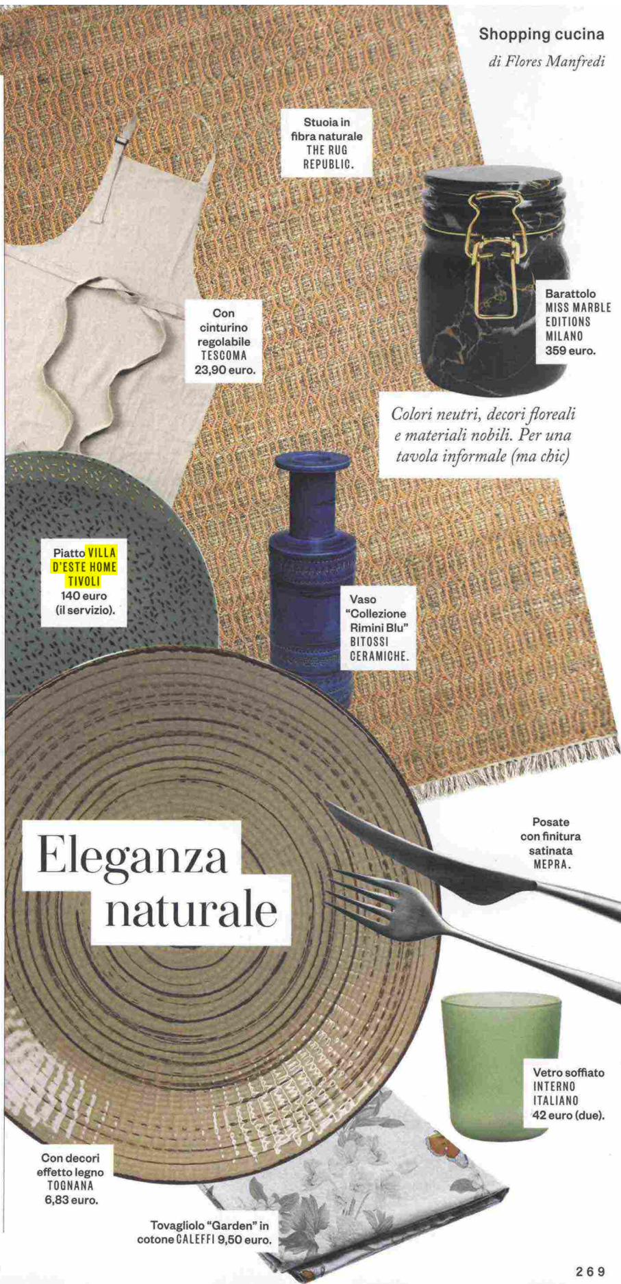
Stuoia in fibra naturale THE RUG REPUBLIC.